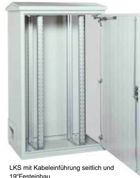
LKS mit Kabeleinführung seitlich und 19" Festeinbau