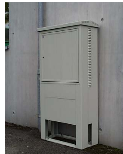
LKE Kabine für Erdmontage inkl. Sockel