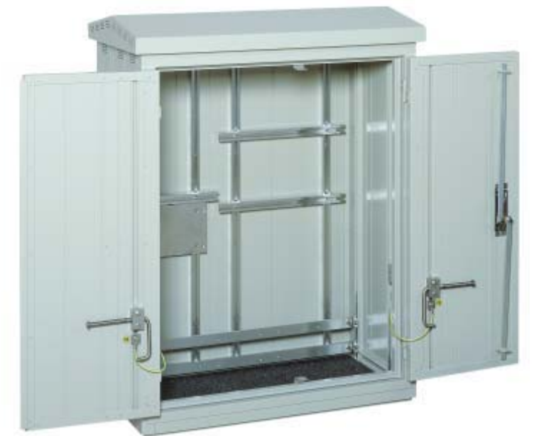
LKS mit Außenscharnier und Schienenrost, Türarretierung 180°